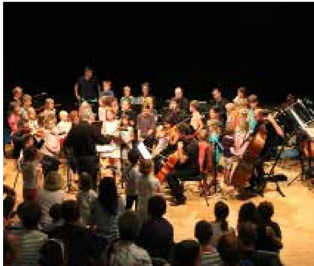
Concert jeune public 2019