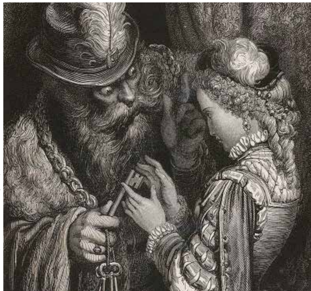
La Barbe bleue confiant le trousseau de clés à sa jeune épouse. Illustration de Gustave Doré (1867).

Barbe-Bleue, d'abord réticent, cède au nom de l'amour, mais la septième porte fait l'objet d'un interdit particulier que Judith va transgresser au prix de sa déchéance, elle trouvera derrière celle-ci les femmes disparues de Barbe-Bleue encore en vie.