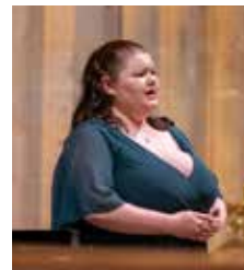
India Lord Mezzo-soprano