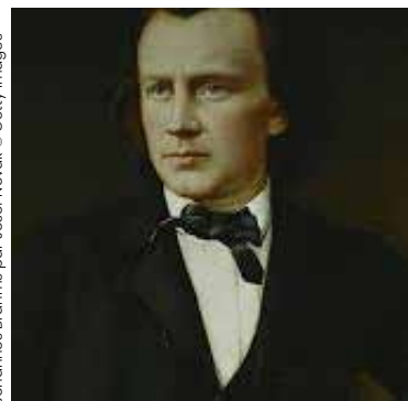
Johannes Brahms par Josef Novak © Getty Images

Brahms commence à écrire Le Requiem en 1865, l'année de la mort de sa mère. Ce n'est pas une musique pour la messe des morts. Brahms a lui-même assemblé les textes, tous sont bibliques. Son choix délibéré de textes qui mettent en valeur la destinée humaine faite de réconfort, d'affliction, d'espoir, de joie, de tristesse et de quiétude, en fait un Requiem essentiellement terrestre, plutôt qu'évoquant le royaume du paradis ou les ténèbres de l'enfer. Il a écrit à propos du Requiem : « Pour ce qui est du titre, je dois admettre que j'aurais aimé exclure le mot « Allemand » et parler plutôt de l'« Humanité ». Et ainsi, cette œuvre n'est pas simplement une célébration de sa mère mais un message d'espoir et de consolation à l'humanité tout entière. « Ils seront réconfortés ».