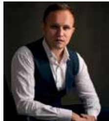
Ihor Mostovoi Baryton basse