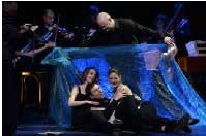
King Arthur Siens Paris BarokOpera

Arthur, le Breton, combatta vaillamment, inspiré par Merlin, afin d'arracher la douce Emmeline aux griffes du cruel saxon Oswald, et régner sur une Bretagne unifiée. L'intrigue, pleine de rebondissements, repose sur la rivalité qui oppose deux souverains : Arthur, chrétien, breton et Oswald, païen et saxon. A cet antagonisme politique répond une rivalité magique, celle des deux enchanteurs Merlin et Osmond, chacun au service de l'un des rois. L'enjeu de l'affrontement est la possession de la Bretagne et celle de la jeune et belle aveugle Emmeline. Après maintes épreuves surmontées par Arthur, Emmeline sera délivrée des maléfices saxons, retrouvera la vue et s'unira à Arthur. Une ère de paix et de prospérité s'ouvrira ainsi pour le royaume.