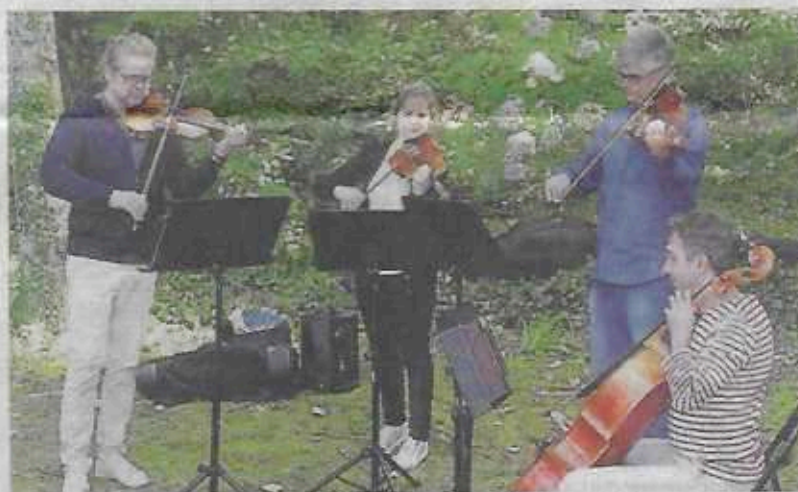
Un groupe de musiciens à cordes dans le jardin du Réduit B, à l'occasion des 25 ans du Festival lyrique international de Belle-Ile.