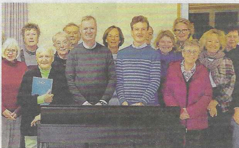
Le Chœur du lyrique, dans la salle Saint-Joseph, lundi.

Le Chœur du lyrique s'est réuni pour démarrer sa saison