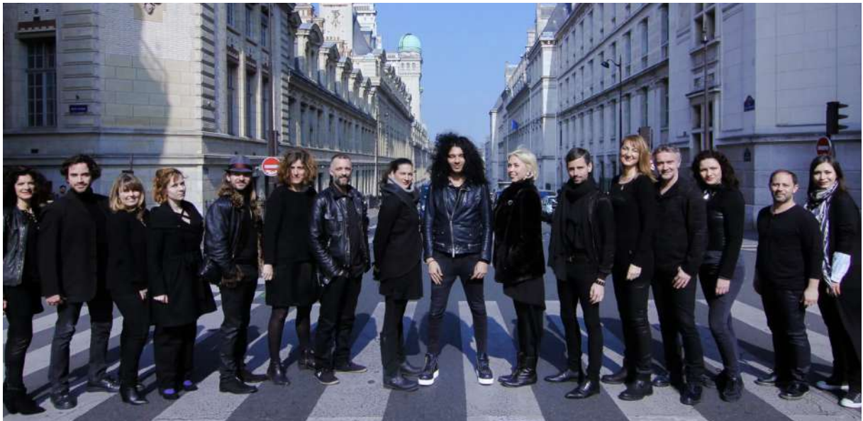
Nemanja Radulovic et Double Sens

Concert d'ouverture du festival : mercredi 26 juillet à 19 h 30, au jardin botanique à Le Palais : Nemanja Radulović et son ensemble Double Sens joueront la musique de leur album Roots . Nemanja Radulovic est l'ange noir de sa génération. Musicien prodige et concertiste fougueux, il galvanise les troupes de l'Ensemble Double Sens. Le jeune violoniste serbe parcourt les scènes du monde sur les chemins escarpés de ses interprétations hors normes et prodigieusement musicales.