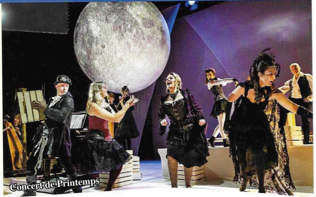
Concert de Printemps