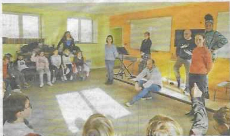
Faire découvrir l'opéra aux enfants des écoles et des collèges, un des objectifs de la troupe des variétés lyriques de Roanne.

Des Voix lyriques, vendredi 10 février à 18 h 30, salle Arletty. Entrée gratuite avec participation solidaire.