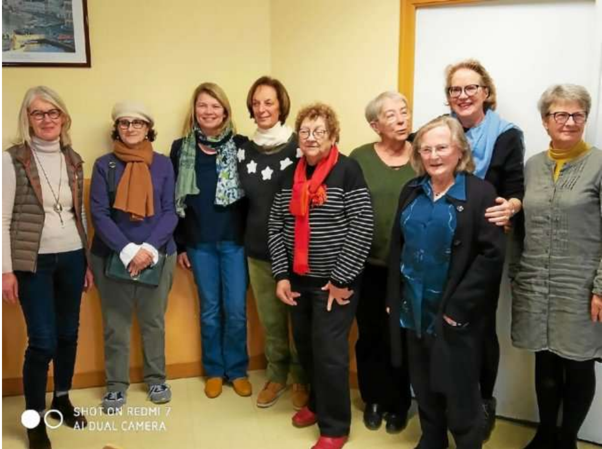
Les membres du conseil d'administration du festival Lyrique en Mer.

À la suite de son assemblée générale, le 24 février, l'association qui organise le festival Lyrique en Mer, à Belle-Île, a dévoilé les dates et le programme 2023.