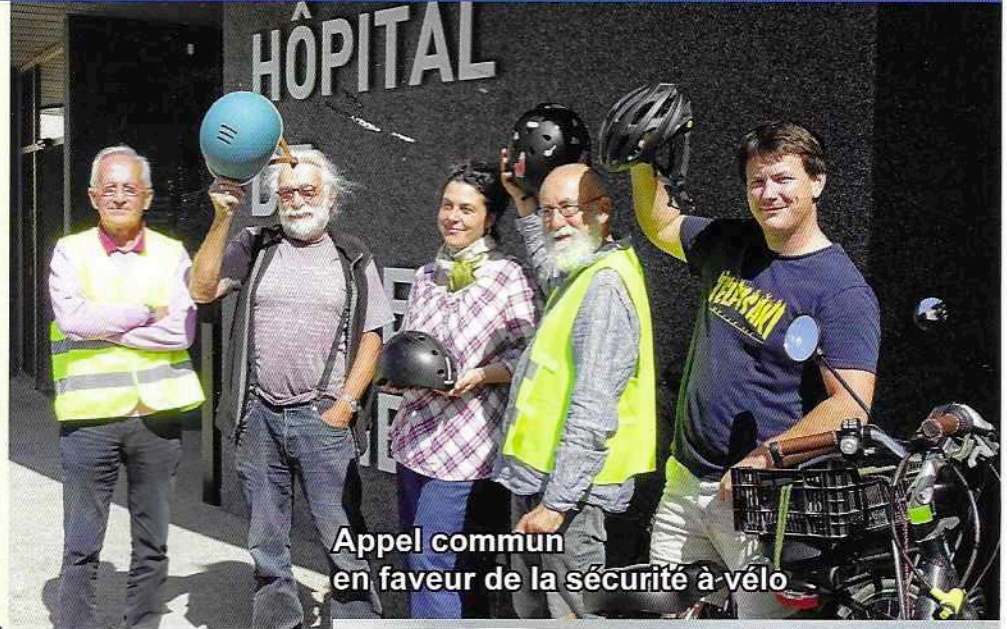
Appel commun en faveur de la sécurité à vélo