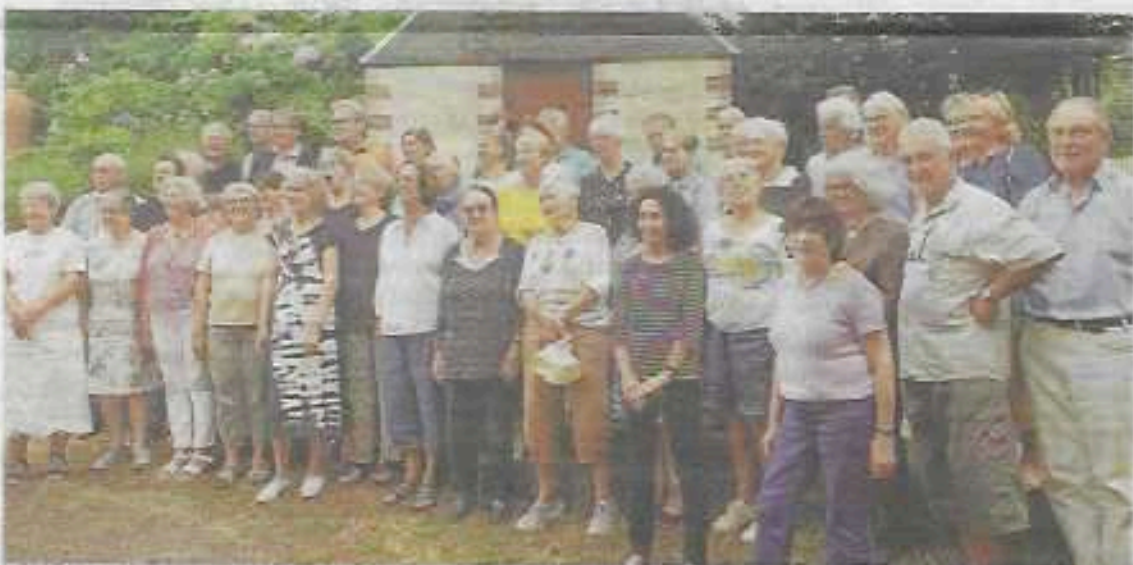
Les bénévoles du festival Lyrique en mer fêlent entre eux et en avance les 25 ans du Festival à venir.

Festival Lyrique en Mer. Du mercredi 26 juillet au samedi 12 août. Programme et vente de billets à retrouver sur le site internet : lyrique-belle-ile.com et via l'office de Tourisme au Tél : 02 97 31 81 93.