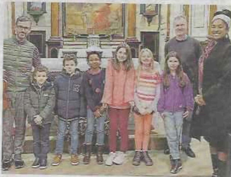
Les enfants avec le soprano et les musiciens.

Le concert de Nouvel an a réuni plus de 300 personnes